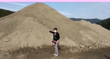
日本共産党県議団調査 紀北町 2018年12月1日、2019年1月22日

県外から、船などによって運び込まれ積み上がり投棄されていた建設残土について、環境上の問題、防災上の問題から条例を作って規制すべきと求めていました。